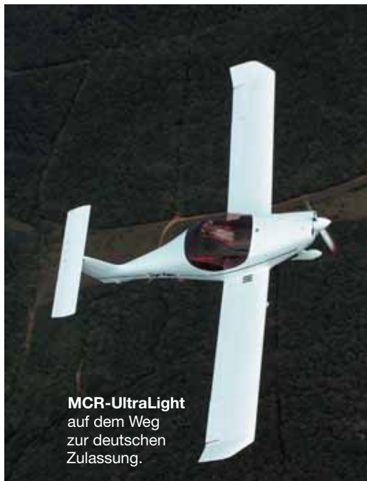
MCR-UltraLight auf dem Weg zur deutschen Zulassung.